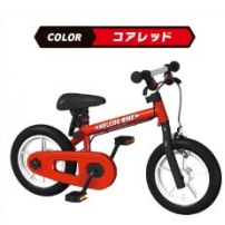
▶ ケルコグバイク コアレッド