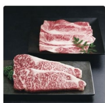
▶ 「米沢牛黄木」米沢牛焼肉・ステーキセット