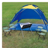
▶ STKコレクション バーベキューセット